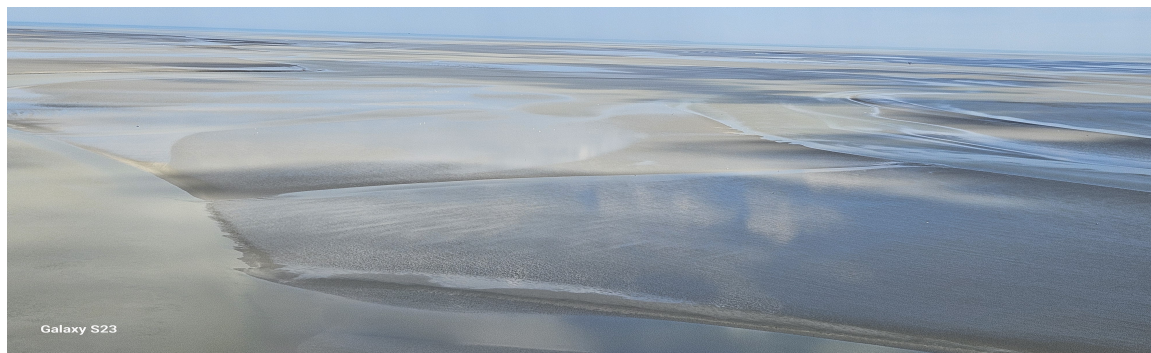
La marea che sale lentamente a LE MONT-SAINT-MICHEL

Considerazioni : l'itinerario di questo viaggio è stato veramente bellissimo , esattamente ciò che noi cerchiamo: un mix di natura, storia, arte e piccoli borghi che hanno reso ancora più speciale il viaggio. Sicuramente la mancanza di tempo ha reso il tutto molto concentrato ma non per questo meno rinvigorente e speciale. Ciò ci induce a programmare per il prossimo anno , un eventuale ritorno aggiungendo nuove mete e riguastando ciò che troppo velocemente abbiamo visitato questo anno. La Francia non delude mai noi camperisti, sia per accoglienza di AA che per luoghi d'interesse.